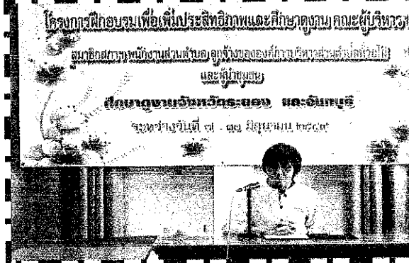
[Blank caption box]