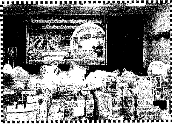
[Blank caption box]