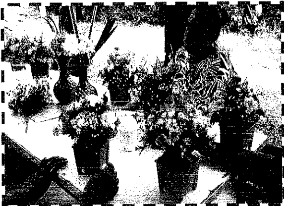
[Blank caption box]