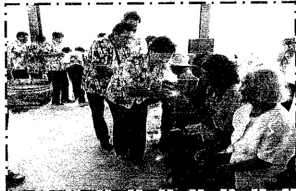
[Blank caption box]